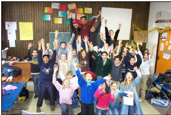
Kurs 5 b,d,f,g am 18.12.02