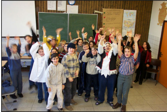
Kurs 5 a,e,c am 17.12.2002