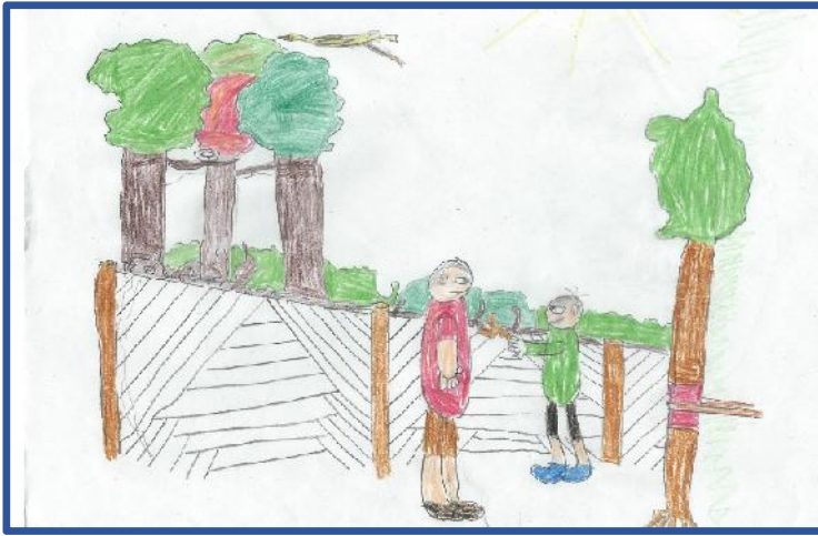
Playing in the wood